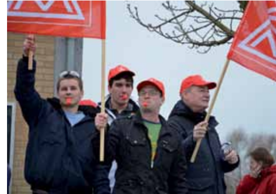
Warnstreik bei Eaton Technologies

„Wir haben es geschafft, dass alle Regelungen des Tarifvertrages auch für dual